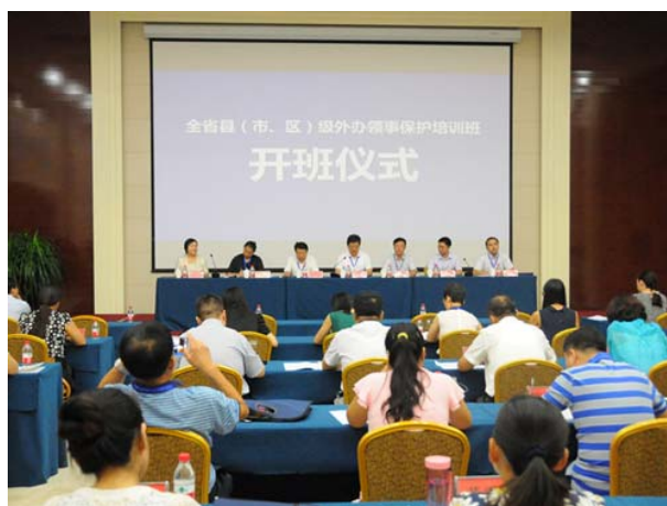
全省县（市、区）级外办 领事保护培训班