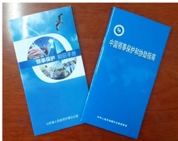
领事保护知识手册 中国领事保护和协助指南