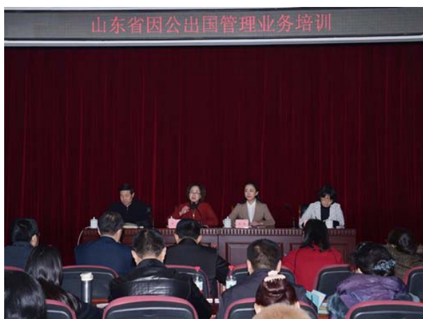
山东省因公出国管理业务培训班

组织开展外事干部培训，使外事干部队伍也成为外事政策法规宣传队伍。本年度就因公出国管理政策举办培训 7 次，参训人员达 520 名；举办全省县（市、区）级外办领事保护培训班 3 期，参训人员达 200 余人。