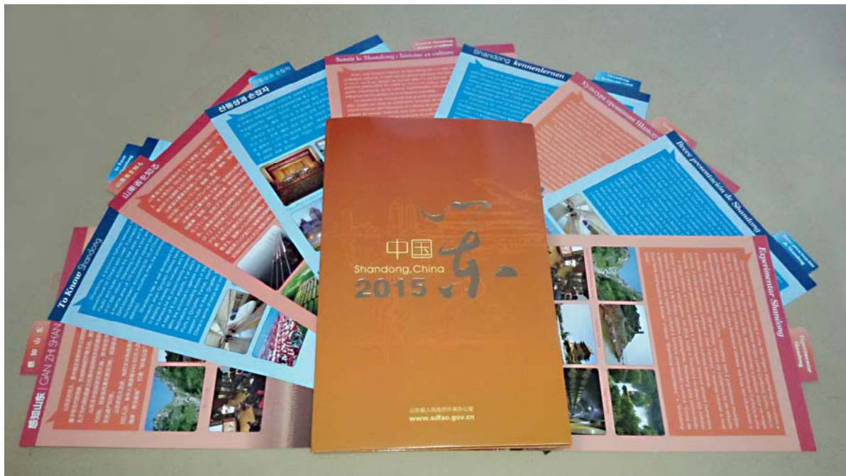
“中国山东”宣传手册

东外事》期刊 6 期；向国内外发放“中国山东”宣传手册（中、英、日、韩、法、德、俄、葡、西）9 个语种 6000 余册等。